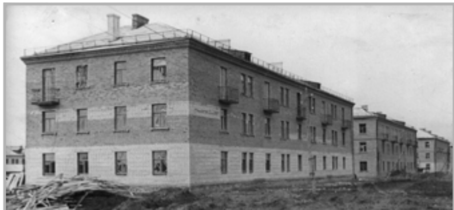
... И назвали улицу – Пионерская.

Дома рабочих завода ПМЗ, построенные своими силами (октябрь 1957 г.)