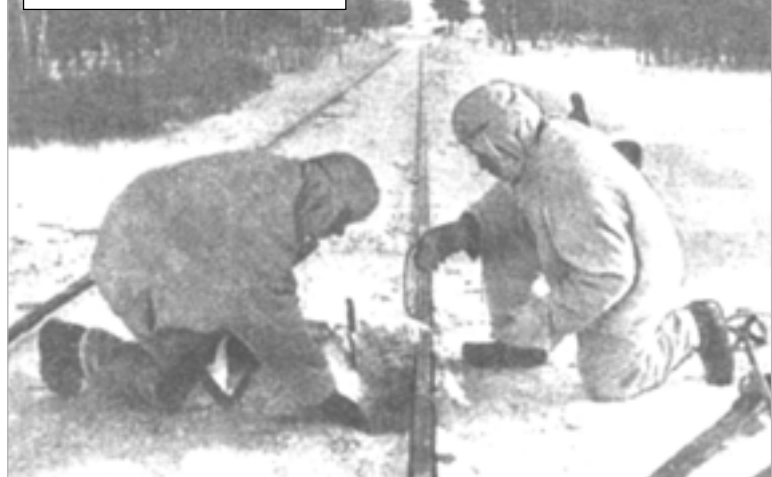
Участие десантников в «рельсовой войне».