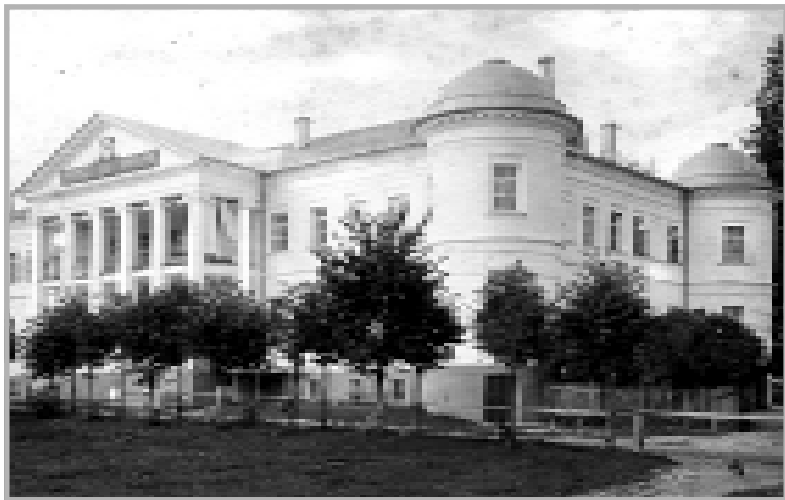
Поливановская учительская семинария. Снимок начала XX века.