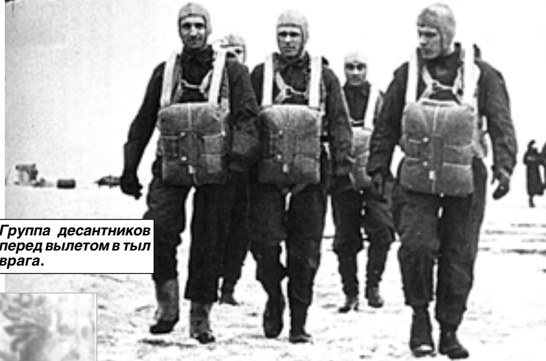
Группа десантников перед вылетом в тыл врага.

Еще на пороге Великой Отечественной войны наши молодые воздушно-десантные войска получили свой первый боевой опыт на Халхин-Голе. В июне 1940 года они участвовали в походе Красной Армии в Западную Украину, Западную Белоруссию и Бессарабию.